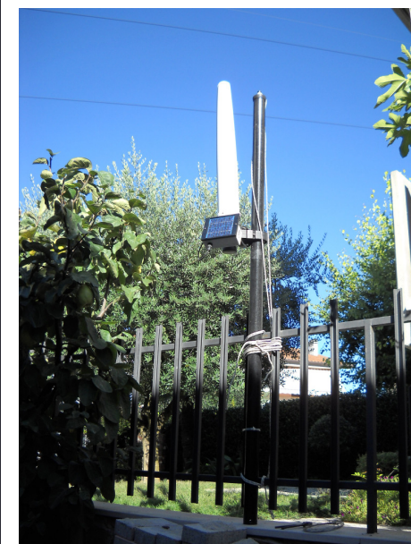
*I picchi corrispondono ai momenti in cui si attiva il modem della centralina.