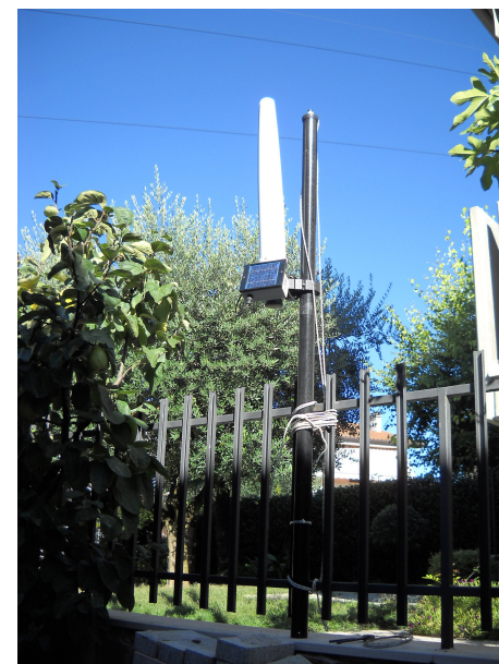
*I picchi corrispondono ai momenti in cui si attiva il modem della centralina.