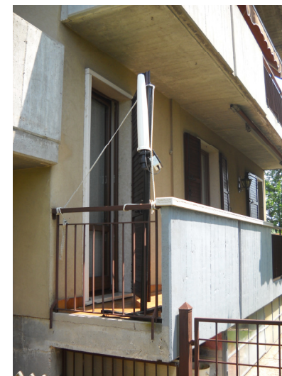
*I picchi corrispondono ai momenti in cui si attiva il modem della centralina.

Obiettivi di qualità: da rispettare nella progettazione di nuovi elettrodotti e nella progettazione di nuovi insediamenti abitativi, di nuove aree gioco per l'infanzia, di nuovi ambienti scolastici e in generale di luoghi adibiti a permanenza di persone non inferiore a quattro ore giornaliere in prossimità di linee ed installazioni elettriche già presenti sul territorio ( 3 µT ).