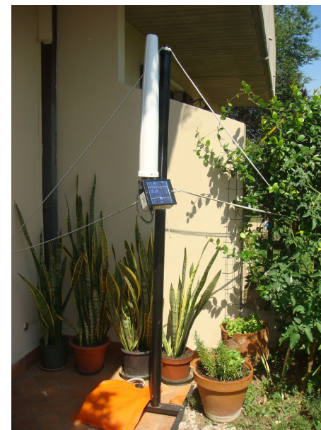
*I picchi corrispondono ai momenti in cui si attiva il modem della centralina.