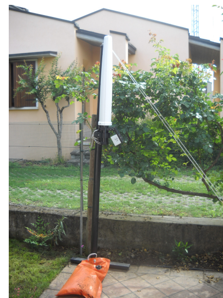
*I picchi corrispondono ai momenti in cui si attiva il modem della centralina.