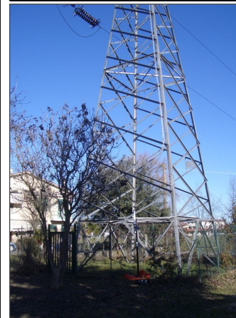
*I picchi corrispondono ai momenti in cui si attiva il modem della centralina.

Il campo magnetico è una grandezza fisica direttamente proporzionale alla corrente che circola nelle linee (non dipende dalla tensione di linea), quindi varia nel tempo in funzione del solo carico collegato ai capi delle linee. Il campo magnetico non viene schermato dalle normali strutture esistenti (edifici, vegetazione, persone) e diminuisce allontanandosi dai conduttori. I livelli di riferimento previsti sono indicati nel DPCM 08/07/03 "Fissazione dei limiti di esposizione, dei valori di attenzione e degli obiettivi di qualità per la protezione della popolazione dalle esposizioni ai campi elettrici e magnetici alla frequenza di rete (50 Hz) generati dagli elettrodotti." (Gazzetta Ufficiale n. 200 del 29 agosto 2003).