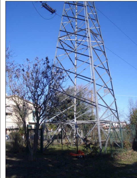
*I picchi corrispondono ai momenti in cui si attiva il modem della centralina.