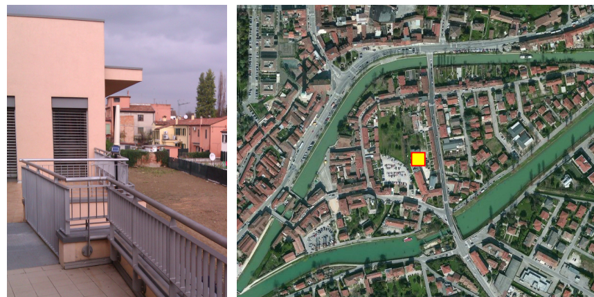
Name: 20ipm_12_2014 Date: 02/12/2014 Time: 00:01