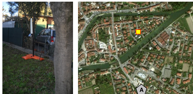
Name: Export Date: 01/05/2012 Time: 00:01