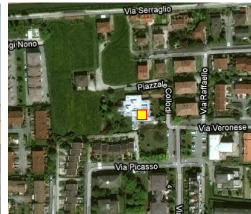
Name: 18pmm Date: 01/04/2013 Time: 00:00