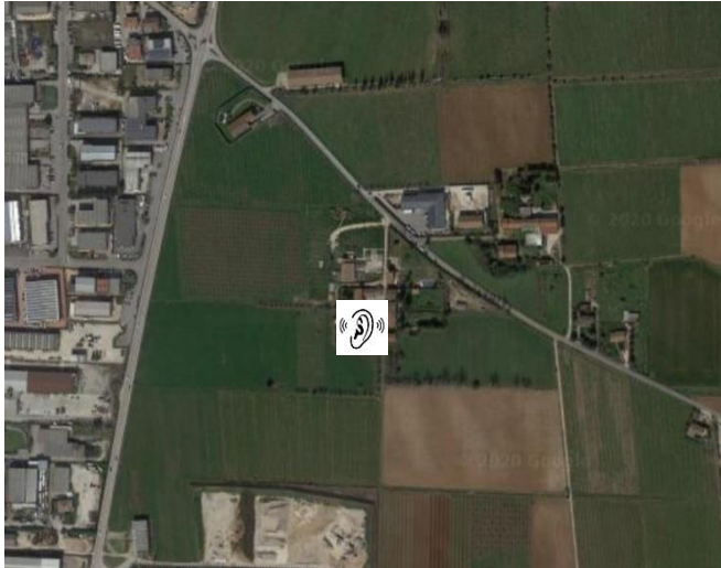
Foto non disponibile