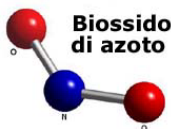
Biossido di azoto