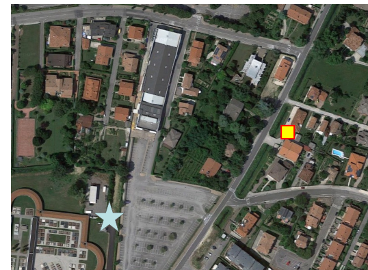
Name: 15pimm_06.2017 Date: 01/06/2017 Time: 00:01