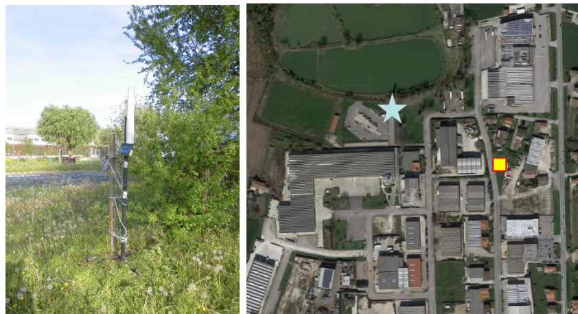
Name: 07pm_06 2017 Date: 01/06/2017 Time: 00:01

I livelli di protezione appena descritti devono intendersi come i valori medi su un'area equivalente alla sezione verticale del corpo umano e su qualsiasi intervallo temporale di sei minuti.