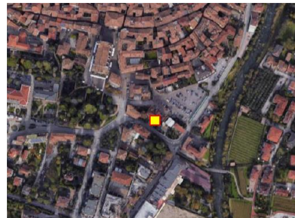
Name: 12-2021_07a Date: 14/12/2021 Time: 11:30