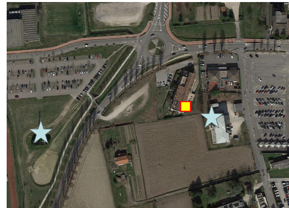
Name: 20pprm_11_2015 Date: 01/11/2015 Time: 00:01