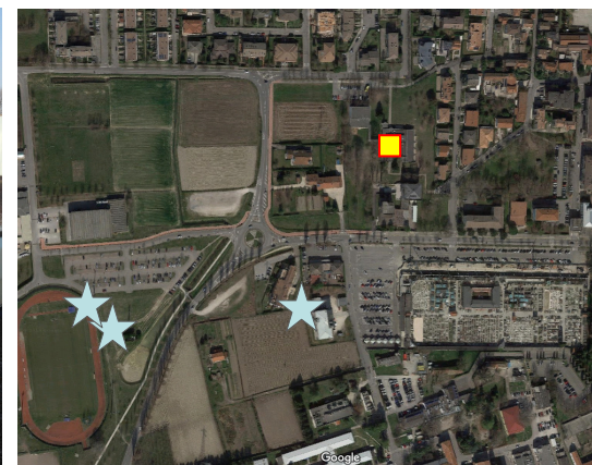
Name: 06prnm_01 2017 Date: 01/01/2017 Time: 00:01