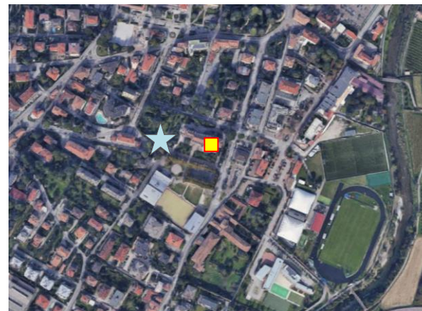
Name: 10-2021_07af Date: 01/10/2021 Time: 00:00