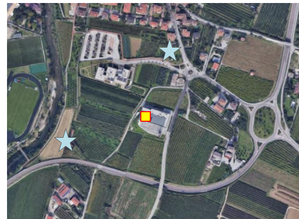
Name: 08-2021_07af Date: 05/08/2021 Time: 00:00