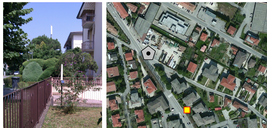
Name: 11pmm_12 Date: 01/12/2014 Time: 00:01