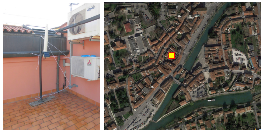
Name: 11prn_10 2015 Date: 01/10/2015 Time: 00:01