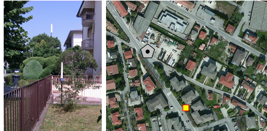
Name: 11prn_04 2015 Date: 01/04/2015 Time: 00:01

I livelli di protezione appena descritti devono intendersi come i valori medi su un'area equivalente alla sezione verticale del corpo umano e su qualsiasi intervallo temporale di sei minuti.