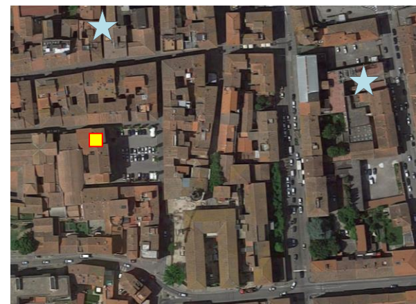
Name: 01_2024_08af Date: 01/01/2024 Time: 00:00