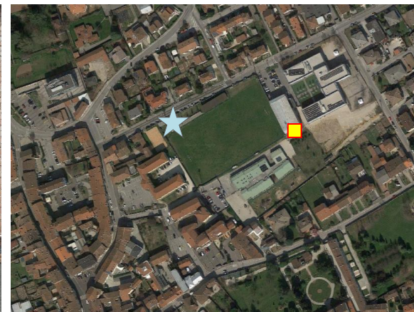
Name: 08-2022_15sf Date: 01/08/2022 Time: 00:00