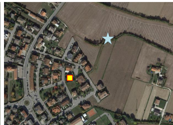
Name: 12-2022_11.tif Date: 28/12/2022 Time: 00:00