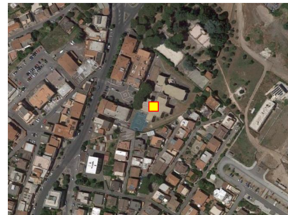
Name: 01-2020_13af Date: 17/01/2020 Time: 14:00