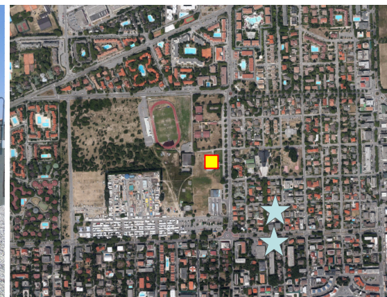
Name: 05pmm_07 2015 Date: 01/07/2015 Time: 00:01