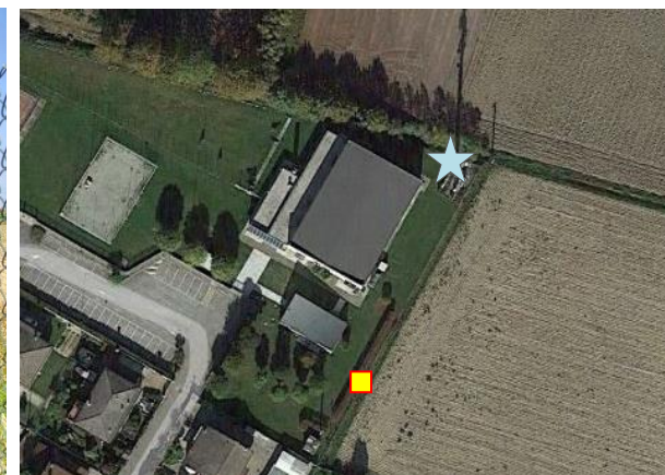
Name: 07-2022_09af Date: 01/07/2022 Time: 00:00