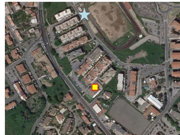
Name: 07-2019_13af Date: 01/07/2019 Time: 00:00