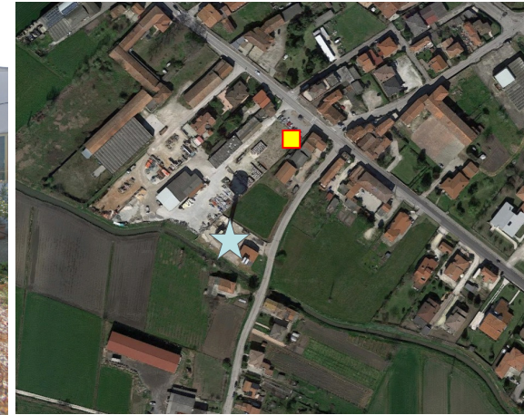
Name: 07pnm_11_2016 Date: 01/11/2016 Time: 00:01