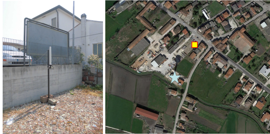
Name: 07prmm_09 2016 Date: 01/09/2016 Time: 00:01