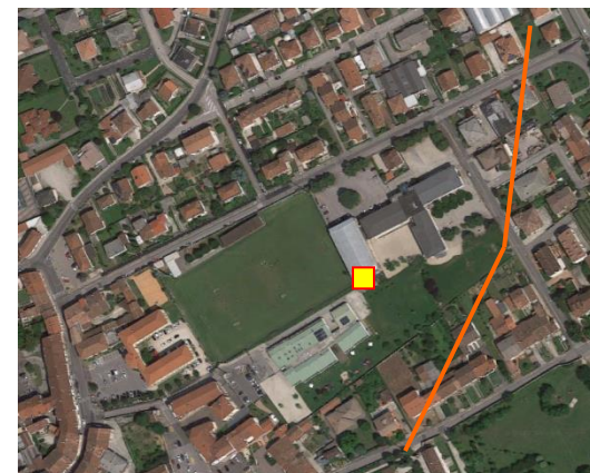
Name: 136f_11 2017 Date: 01/11/2017 Time: 00:00