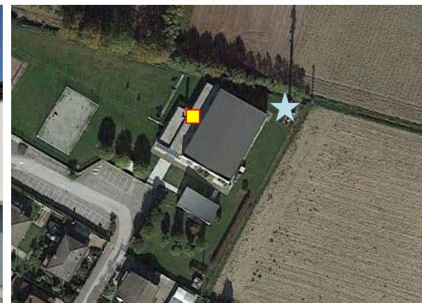
Name: 08-2022_20sf Date: 01/08/2022 Time: 00:00