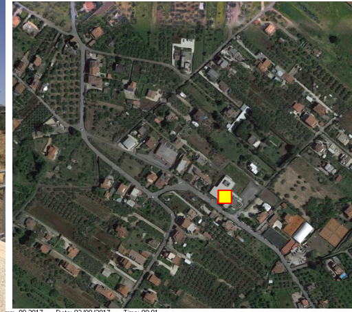
Nome: topmm_08 2017 Date: 03/08/2017 Time: 00:01