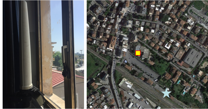
Name: 06ppm_06 2017 Date: 03/08/2017 Time: 15:00