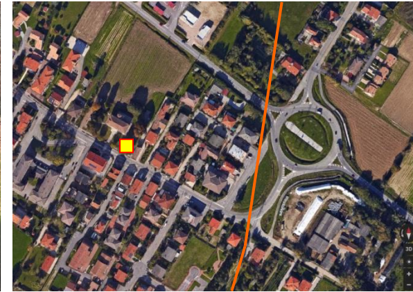
Name: 21bl_11 2017 Date: 01/11/2017 Time: 00:00