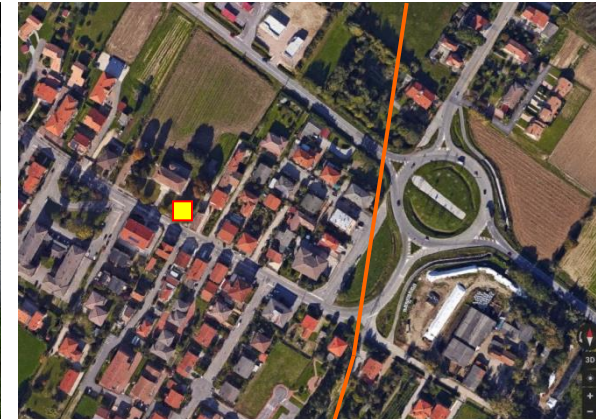
Name: 04bd_09.2017- Date: 14/09/2017 Time: 12:00