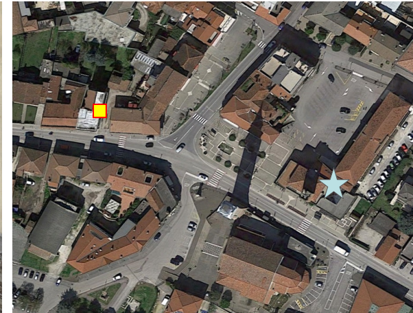
Name: 12pmm_06 2016 Date: 01/06/2016 Time: 00:01