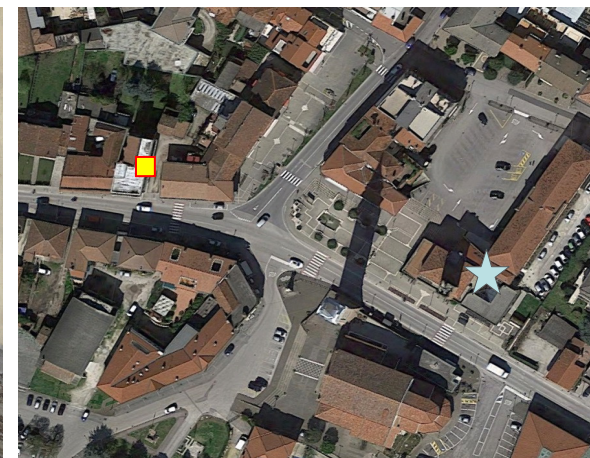
Name: 12prn_03 2016 Date: 15/03/2016 Time: 12:00