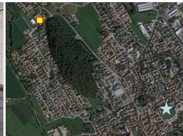
Name: 04-2021_15sf Date: 01/04/2021 Time: 00:00