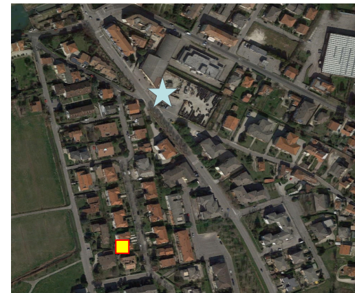
Name: 11prnm_03 2016 Date: 01/03/2016 Time: 00:01