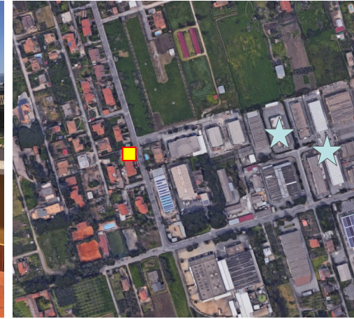
Name: 18pmm_05 2017 Date: 01/05/2017 Time: 00:01