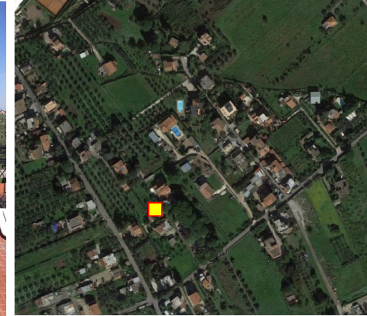
Name: 03pmm_06 2017 Date: 01/06/2017 Time: 00:01