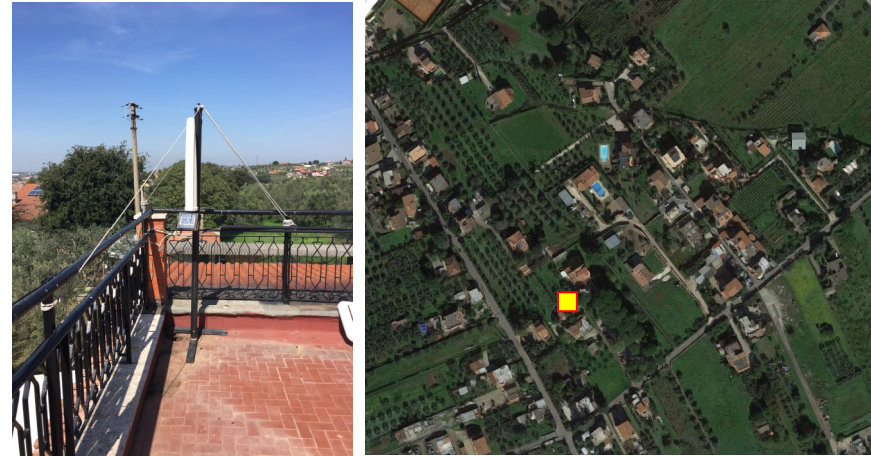
Name: 08prim_05 2017 Date: 01/05/2017 Time: 00:01