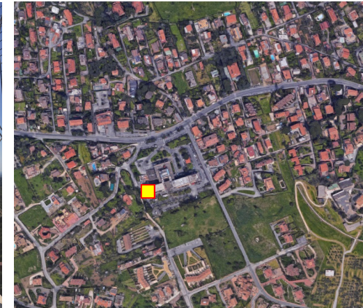
Name: 12pmm_062017 Date: 01/06/2017 Time: 00:01