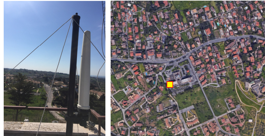
Name: 12pmn_05_2017 Date: 01/05/2017 Time: 00:01