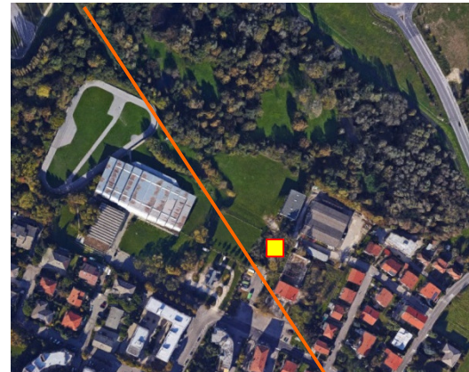
Name: 04h_09 2017 Date: 01/09/2017 Time: 00:01