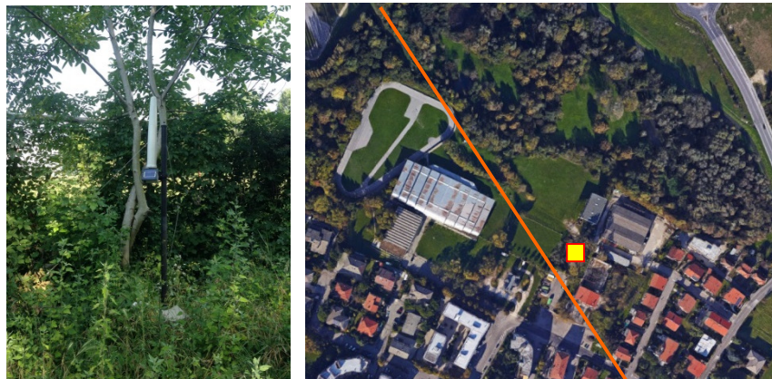
Name: 04bf_08 2017 Date: 01/08/2017 Time: 00:01