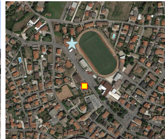
Name: 12pmn_03 2016 Date: 01/03/2016 Time: 00:01