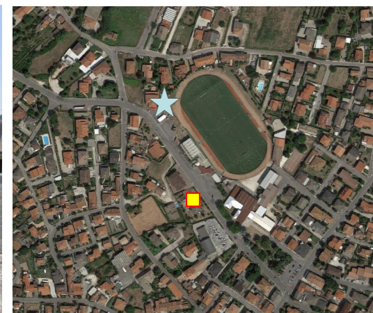
Name: 12pmn_01 2016 Date: 01/01/2016 Time: 00:01